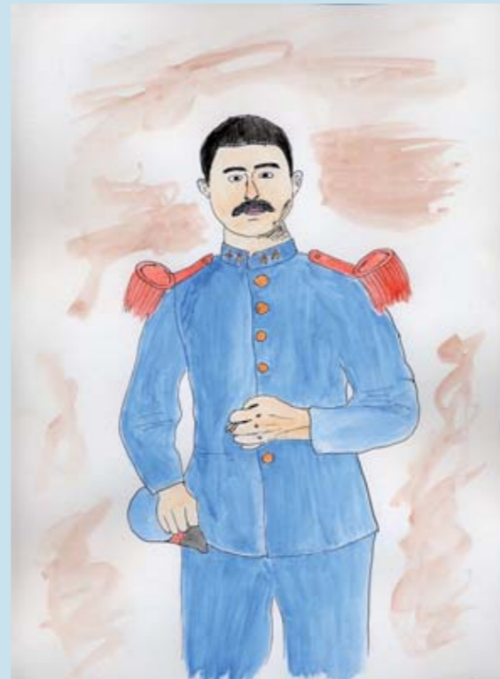
Mention pour la démarche pédagogique : Ecole de Saint-Rémy-sur-Lidoire (24)