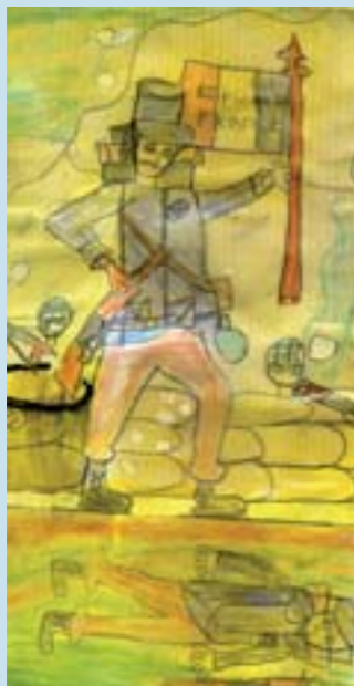
Mention pour l'originalité : Ecole des Rêpes de Vesoul (70)