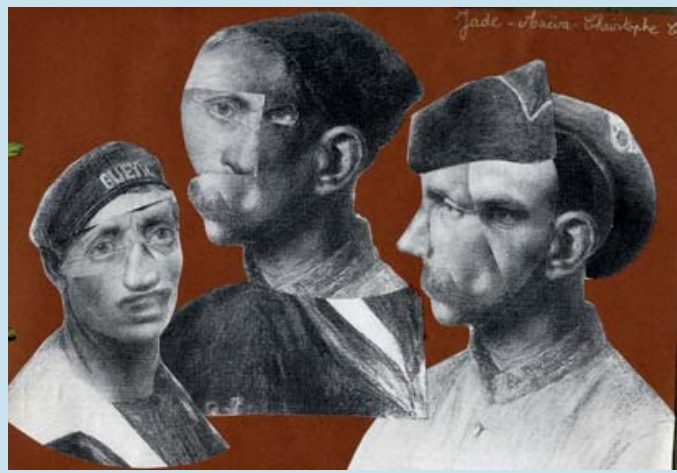
Prix spécial du jury : Ecole élémentaire du Cep à Seynod (74)