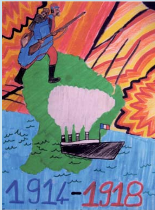
Prix de la première participation : Ecole Edmond Malacarnet de Cayenne (973)