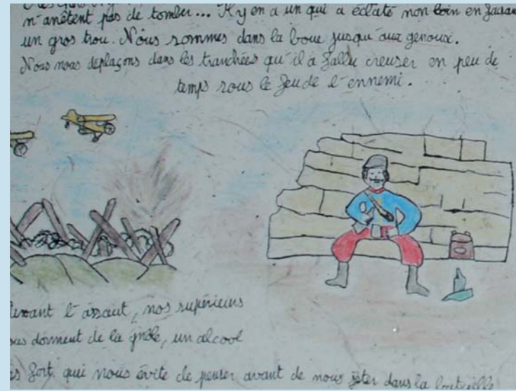
Mention pour la qualité artistique "prix Renefer" : Ecole de Saint-Chaffrey (05)